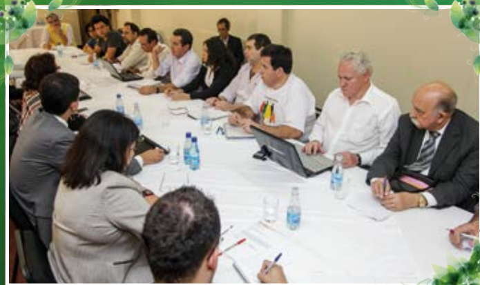
Participando da Rodada de Negociação sobre os PADVs