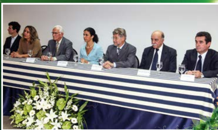
Na reunião de assinatura do PMPP, em março de 2008