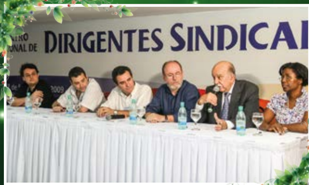
Fazendo seu pronunciamento na Campanha Fome de Justiça