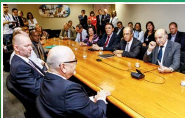
Participando da entrega de crachás da Caixa, aos aposentados