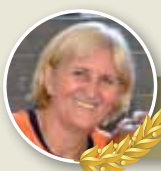
Creuzeny Effigen Vôlei de quadra (fem.)